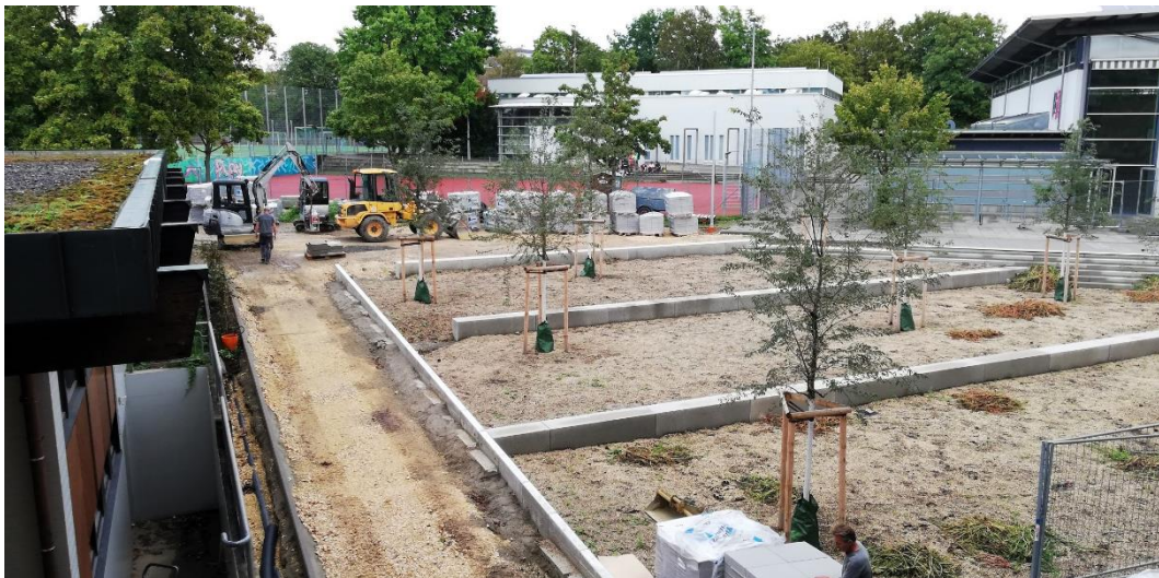
aktuelles Foto (01.09.2023) von unserem Schulhof